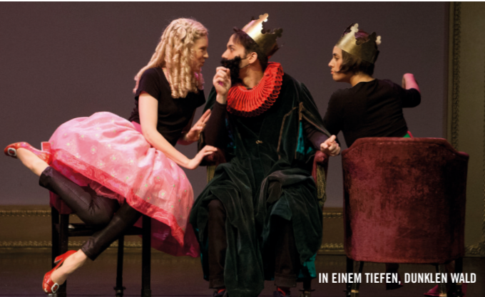
IN EINEM TIEFEN, DUNKLEN WALD

NOMINIERT FÜR DEN DEUTSCHEN THEATERPREIS „DER FAUST“ - KATEGORIE „REGIE SCHAUSPIEL“