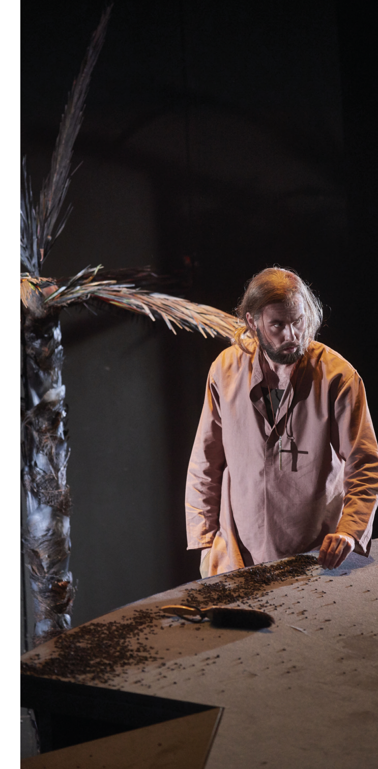
NATHAN DER WEISE DANIEL TILLE